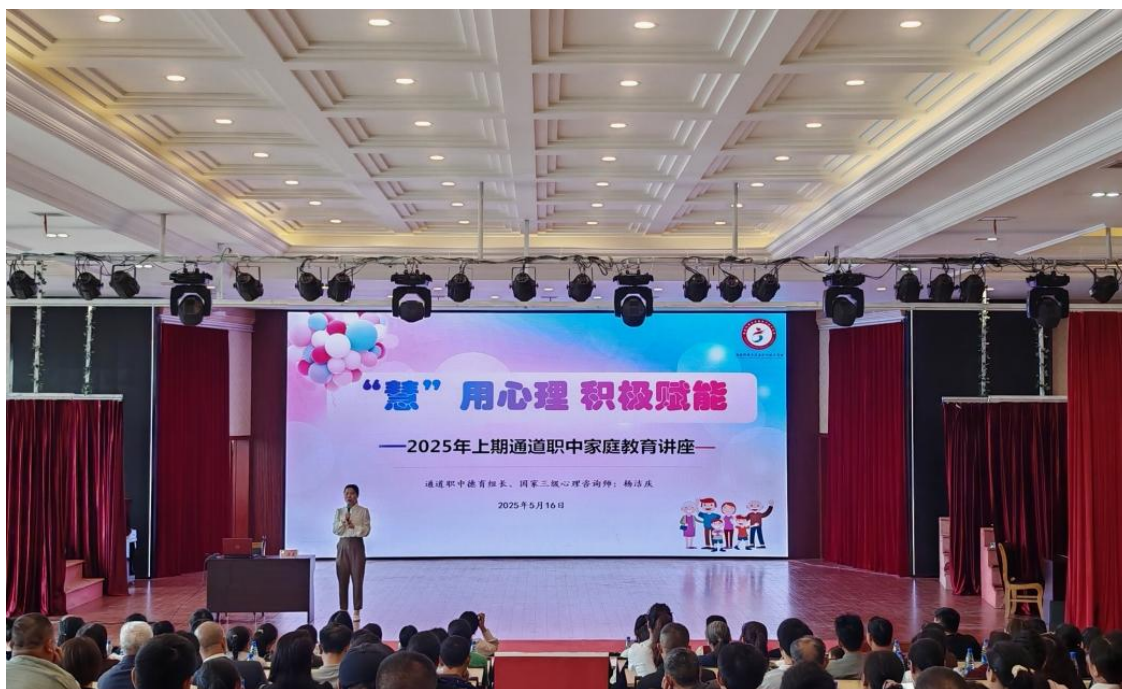
图 1-5：家庭教育心理讲座课

加强专兼职心理健康教师队伍建设（专业心理教师 1 名），常态化开展心理健康教育；新修建心理健康咨询室，为每一位学生建立了心理健康档案，对有心理健康问题的学生安排专兼职心理健康教师进行一对一帮扶、辅导。每年 5 月份为心理健康月，开展心理健康知识讲座等系列主题活动（见图 1-5 和案例 1-2）。