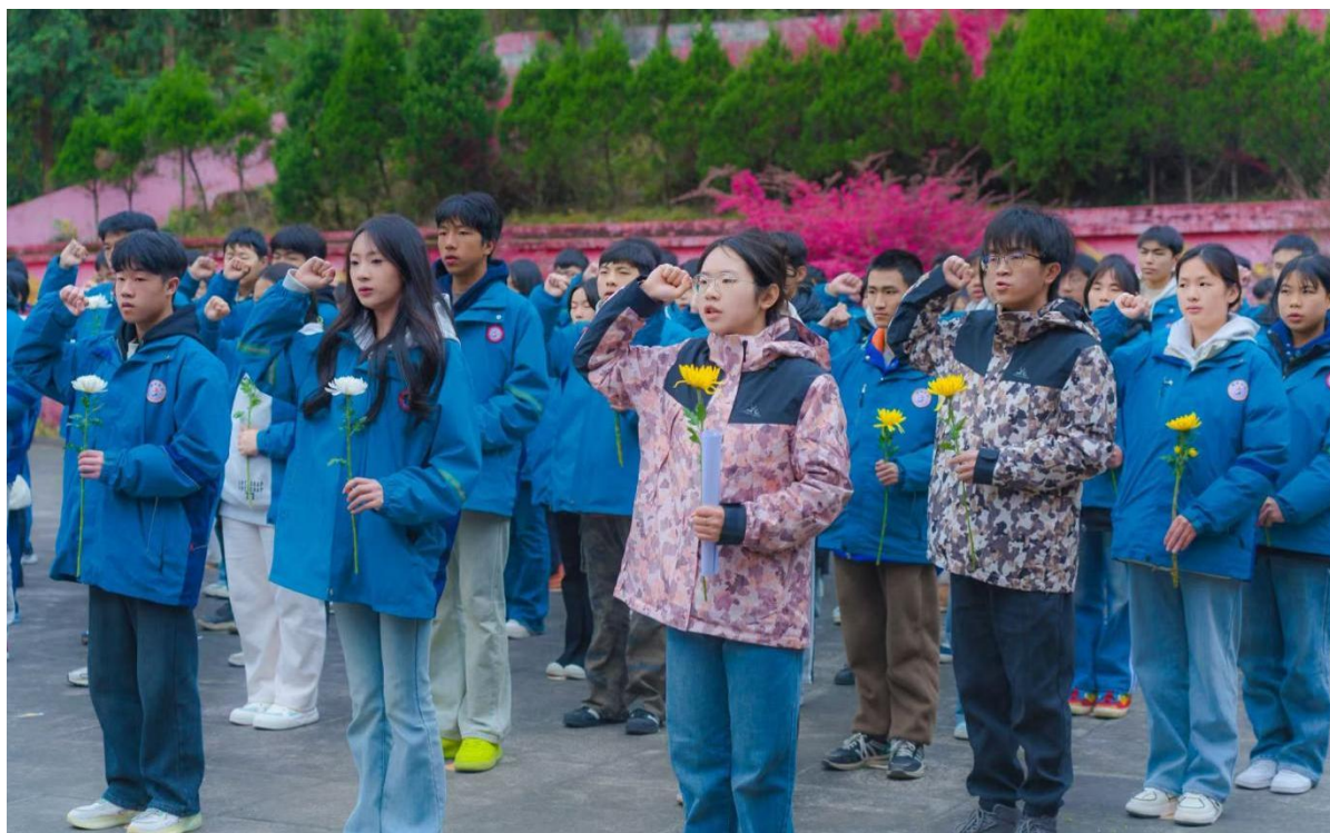
图 1-6：清明祭扫实践活动

校园广播站、学校宣传栏、班级黑板报等渠道宣传“学习雷锋”“传承红色教育”等内容，加强校园文化建设。校团委组织开展“一元捐”等各种志愿服务活动。每周校团委认真准备讲话稿，围绕“安全、卫生、心理健康、文明守纪、感恩教育”等方面开展教育，由优秀学生 and 值周领导发言，提高国旗下讲话的教育效果。