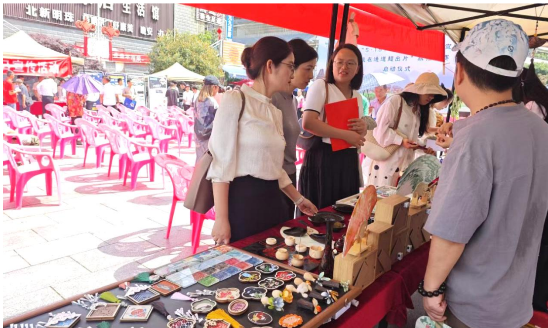
图 2-2：县文旅局局长现场欣赏学生文创作品