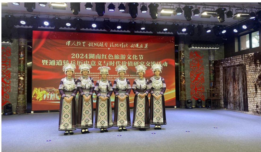
图 2-5：旅游专业学生在湖南红色旅游文化节当引导员

学校与皇都旅游企业建立深度合作，将实习课堂搬进景区实景。学生入驻皇都实习基地，参与旅游线路规划、游客接待、文化讲解等实操工作，把课堂所学转化为服务能力。同时，学生化身志愿讲解员，在侗年节、大戊梁歌会等活动中为游客答疑解惑，既提升了旅游体验，又传播了侗族文化，更通过旅游调研为合作企业提供发展建议，实现教学与产业的双向赋能。