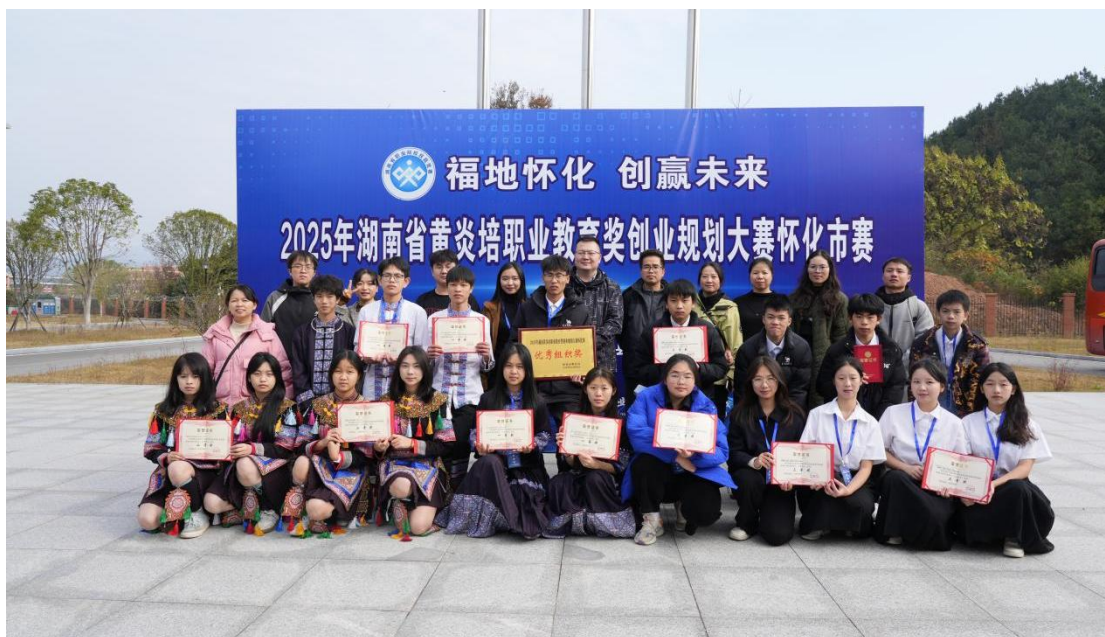
图 5-3：黄炎培创业大赛市赛获奖

在学生实习就业管理方面，学校严格执行教育部下发的《中职学生顶岗实习管理条例》，从实习单位的选择、实习协议的签订到实习过程的跟踪与指导，都进行了规范管理。为学生提供了安全、稳定的实习环境。为进一步激发中职学校师生职业教育创新创业创造活力，打造专创融合教学能手，为实现“三高四新”美好蓝图提供坚实人才支撑和持久动力，2025年12月5日，学校5个团队参加怀化市2025年黄炎培职业教育奖创业规划大赛总决赛（见图5-3），全市共有14支代表队、80余名选手进入现场决赛。最后学校荣得一等奖1项、二等奖1项、三等奖3项，同时学校因组织工作成效显著，被授予“优秀组织单位”荣誉称号。