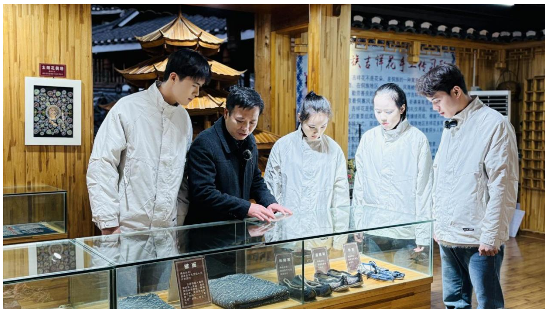
图 2-1：学生受邀参加央视《跟着书本去旅行》节目拍摄