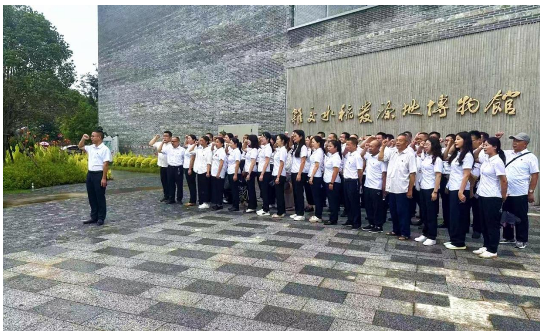
图 1：全校党员到安江农校纪念园开展党建活动

为隆重庆祝建党 104 年，增强党员的凝聚力，在“七一”来临之际，党总支组织开展了赴安江农校纪念园的“传承红色基因 弘扬红色精神”主题党日活动（见图 1），组织党员志愿者进社区开展服务活动 6 次，并组织全体党员观看红色电影，学习党史。