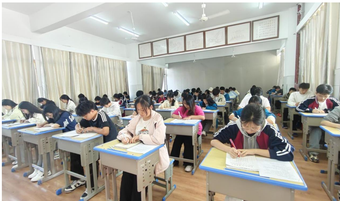
图 1-4：“楚怡读书”学生硬笔书法比赛现场

校园文化活动丰富多彩，将“文明风采”德育实践贯穿教育教学全过程，涵盖班级球类赛事、演讲比赛、手抄报评比、练字打卡、楚怡读书学习（见图 1-4）等活动；以学生社团、技能节、阳光体育等形式活跃校园氛围，提升学生在校体验感。