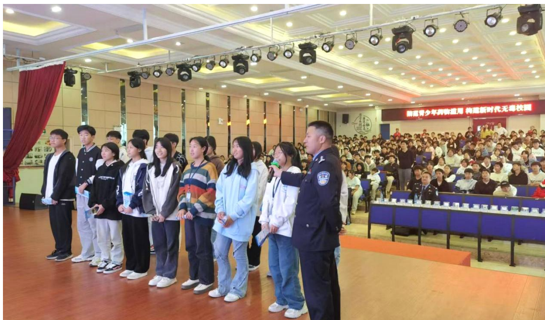
图 4-2：校外专家来校开展讲座