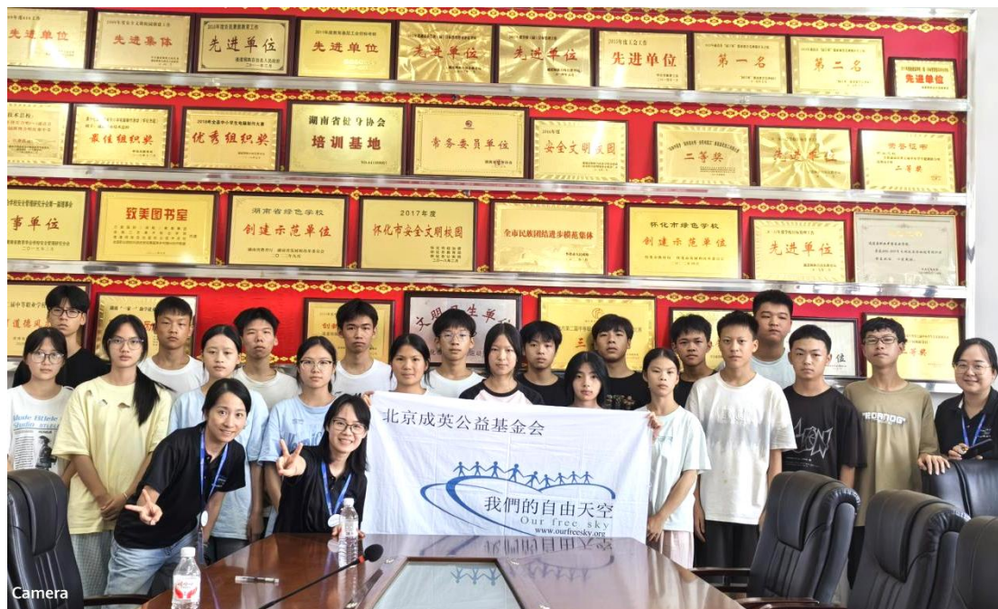
图 2-3：北京成英基金会—我们的自由天空贫困助学金发放

同时，学校加大宣传力度，通过召开座谈会、家长会、主题班会等形式宣传资助政策，让更多的人了解中职家庭经济困难学生这个群体，争取得到更广泛的支持和关注。并做好跟踪服务，积极为每一位家庭经济困难学生提供跟踪资助服务，抓好他们的实习、就业工作，确保学生能够顺利融入社会，实现自我价值。