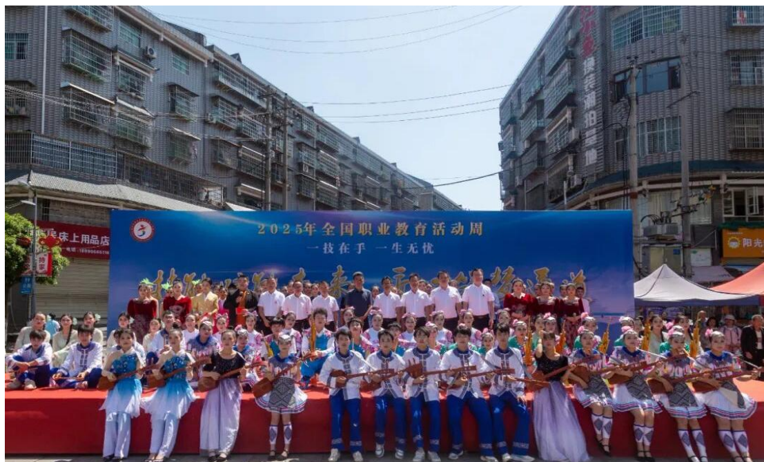
图 3-3：技能活动周现场展演

三年来，学校培养了大批侗族文化传承人才，学生作品多次亮相省市文化展会，部分毕业生返乡投身非遗传承、文旅开发等领域，成为地域文化传播的生力军。学校以教育之力守护文化根脉，为侗族文化的活态传承与创新发展注入持久动力，彰显了职业教育服务地方文化发展的责任担当。