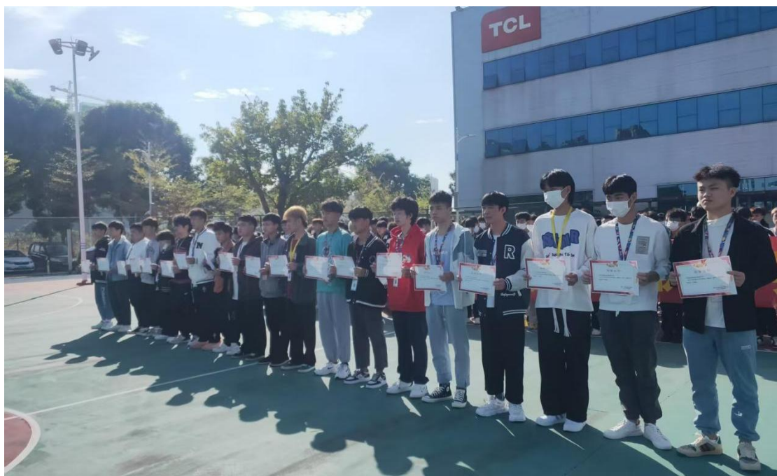
图 4-3：惠州 TCL 通力电子有限公司优秀实习生

严格遵照《职业学校学生实习管理规定》，将实习实训纳入人才培养全过程，规范落实实习管理要求。学校与实习单位、家长及学生签订“三方协议”，实行班主任全程跟踪机制，每学期开展不定时实习检查与安全教育，切实保障实习质量与学生权益。2025 年，学校毕业生共计 512 人，其中 216 人升入职业院校及本科院校深造，289 人实现就业，就业率达 56.44%。实习实训反馈显示，学生满意度为 71.29%，不满意占 11.72%，无法评估占 17.57%。规范的实习管理与多元的升学就业渠道，为学生成长成才提供了坚实保障。