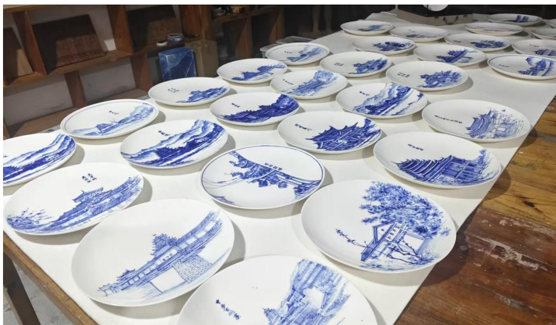
图 3-4：师生共创一县庆 70 周年伴手礼

此外，学校同步开展“非遗潮流”书画展及班会活动，民族艺术团创新融合侗族乐器与流行音乐，在各类活动中精彩亮相。此次多元实践既检验了“非遗进课堂”的教学成果，更拓宽了文化传播边界，让侗族非遗在校园培育、舞台绽放、市集流通、节庆传承中形成闭环，为县域文化活态传承注入持久青春动能。