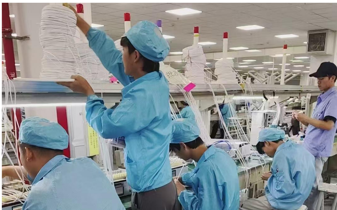
图 4-1：电子电器专业学生在惠州 TCL 通力电子有限公司实习中