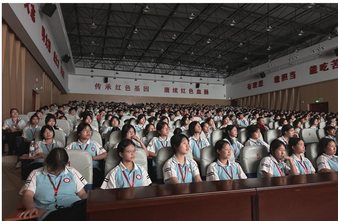
图 3-2：学生“韶山行”研学现场

演奏诠释红色内涵。2023 年起，民族文化技能周增设“湖湘红色主题创作”板块，2024 年县庆展演中，融入湖湘元素的侗族歌舞成为亮点。通过课程浸润、实地研学和创作表达，学生既练就非遗技艺，又厚植湖湘红色基因，相关作品获省市级奖项 13 项，30%毕业生返乡反哺文旅与非遗产业，实现职业教育与双文化传承的深度融合。