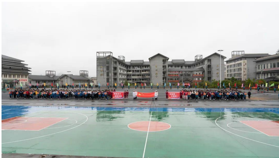
图 1-1：校园教学楼、操场全貌

学校有集实验、实训、演示、交流、比赛、生产、研发于一体的多功能实训大楼，建有两个技能大师工作室。教学仪器设备值 1418.9 万元，生均教学仪器设备值达 8615.06 元；纸质图书 4.9 万册，生均纸质图书 30.05 册，与上年度一致。